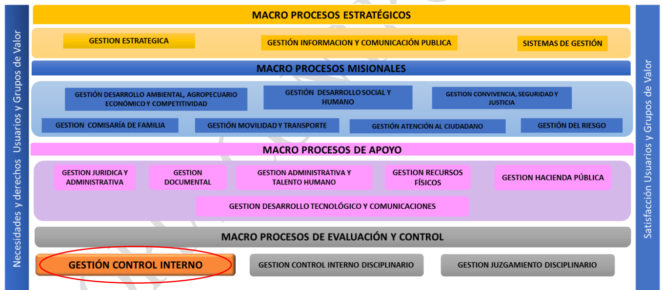
Gráfica 1. Mapa de Macroprocesos Alcaldía de Cartago

El mapa de Macroprocesos de la Administración Municipal de la Alcaldía de Cartago es un instrumento gráfico que le permite a los usuarios (internos y externos) y grupos de valor, identificar la estructura definida para los niveles estratégicos, misionales, de apoyo y de evaluación y control según los lineamientos establecidos por la guía para la gestión por procesos en el marco del Modelo Integrado de Gestión (MIPG).